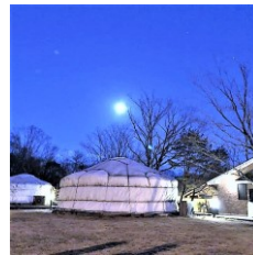
温泉入浴(予定) / モンゴリアビレッジ テンゲル

●こうして、自分と他者を尊重し、自分の意思を大切にしつつ、お互いを認め合う相互の肯定感の中で、協力しながら集団生活を送り、こどもが自信をつけてゆけるキャンプにしてゆきます。